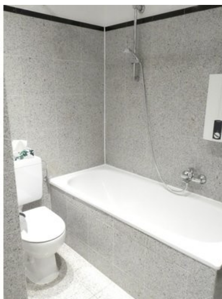
Badezimmer mit Wanne und Duscheinrichtung