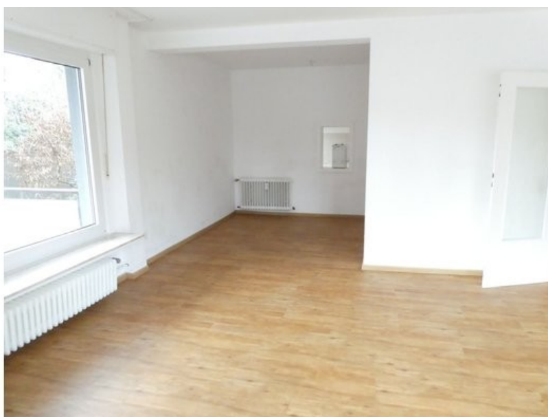
... mit Ess- oder Lesecke