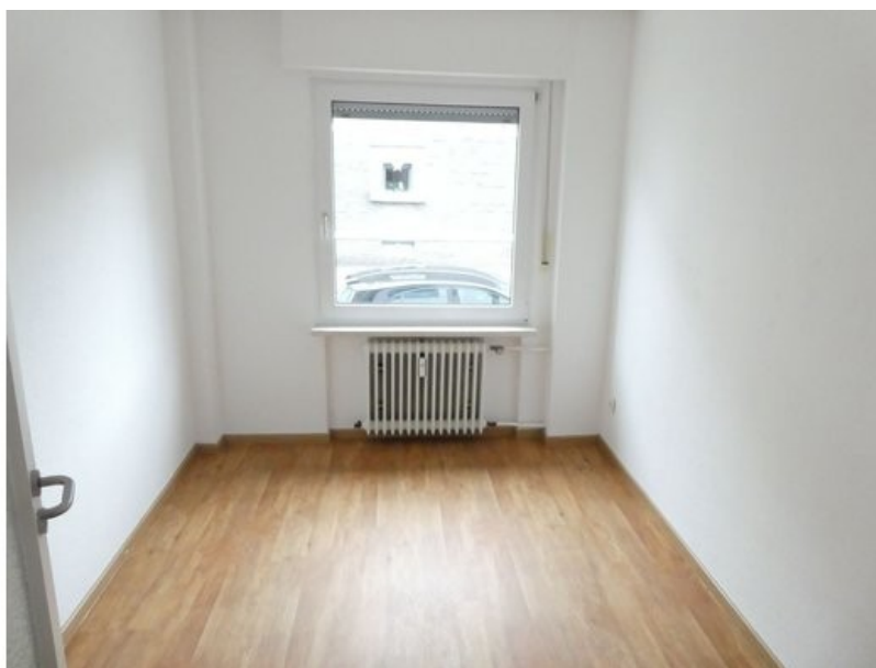
kleines Kinderzimmer oder Büro