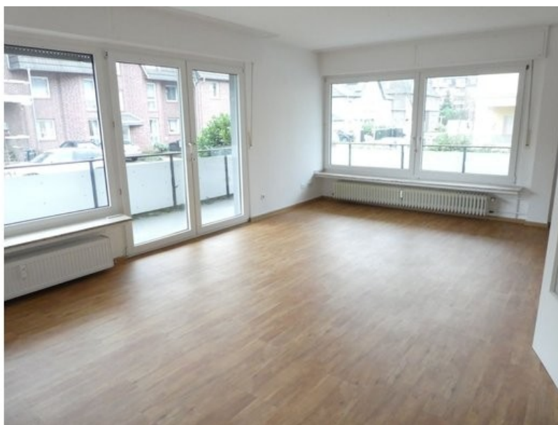
... im gepfl. 4-Fam.-Haus