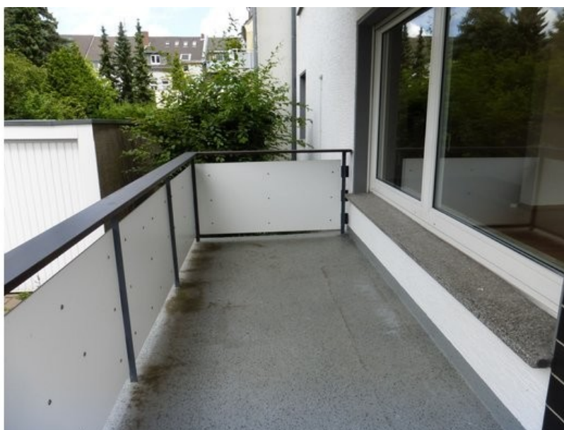
... über Eck