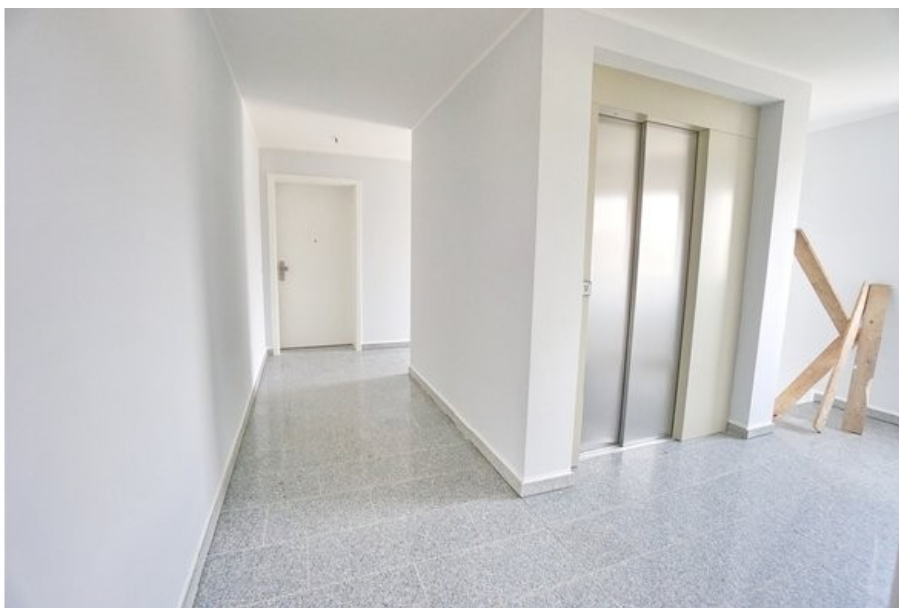
Flur mit Aufzug