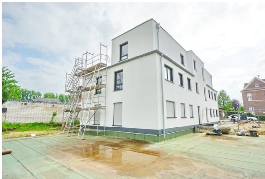
Alpen-Menzelen: Eigentumswohnung im Neubau