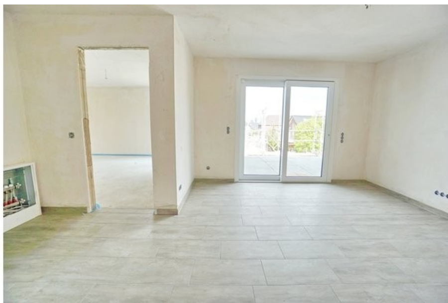
... mit Zugang zur Dachterrasse