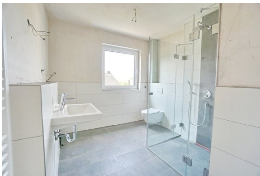
Bad mit begehbare Dusche