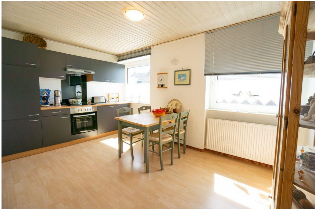
Küche im OG