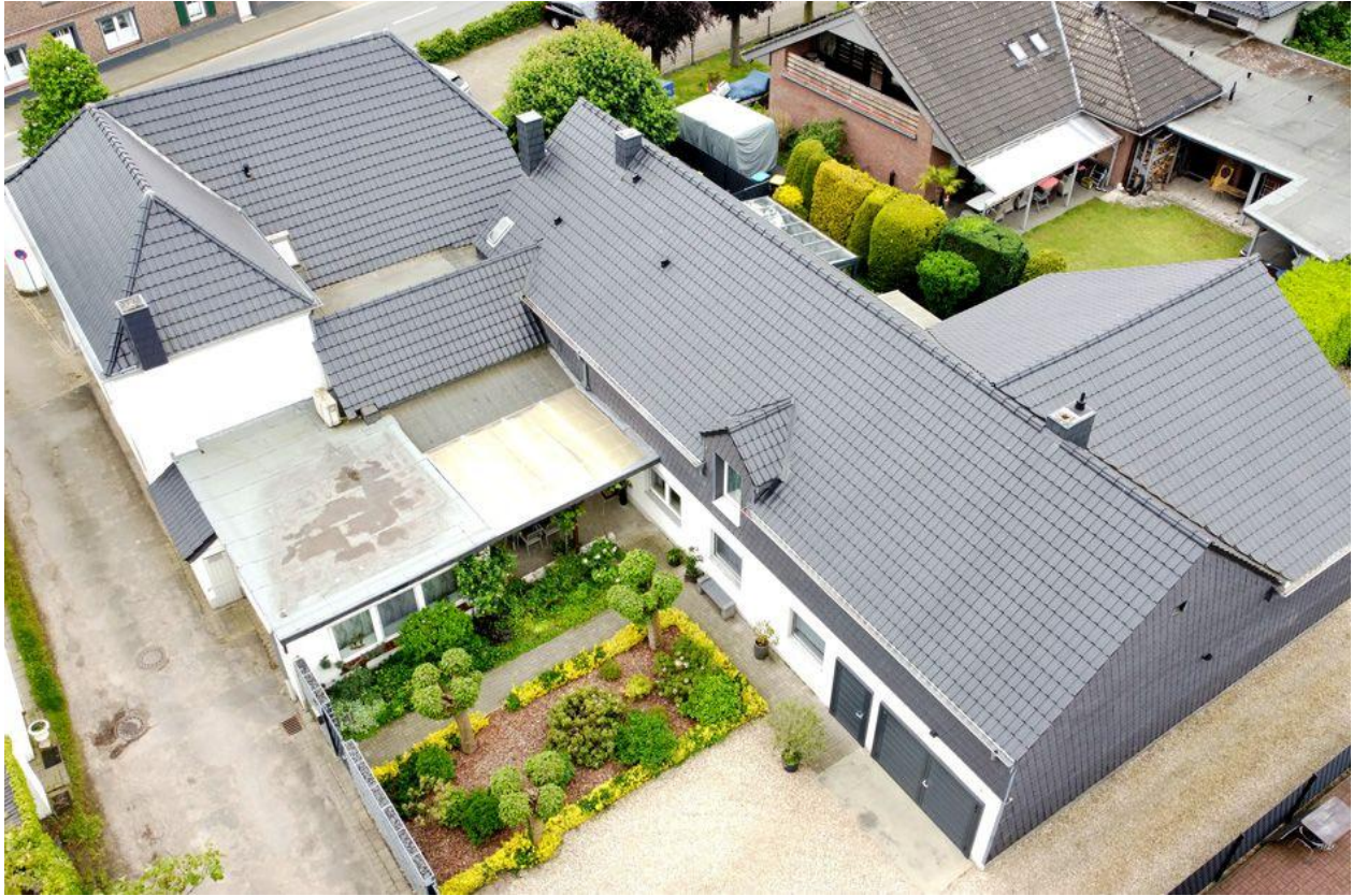
Kamp-Lintfort: Großes Anwesen