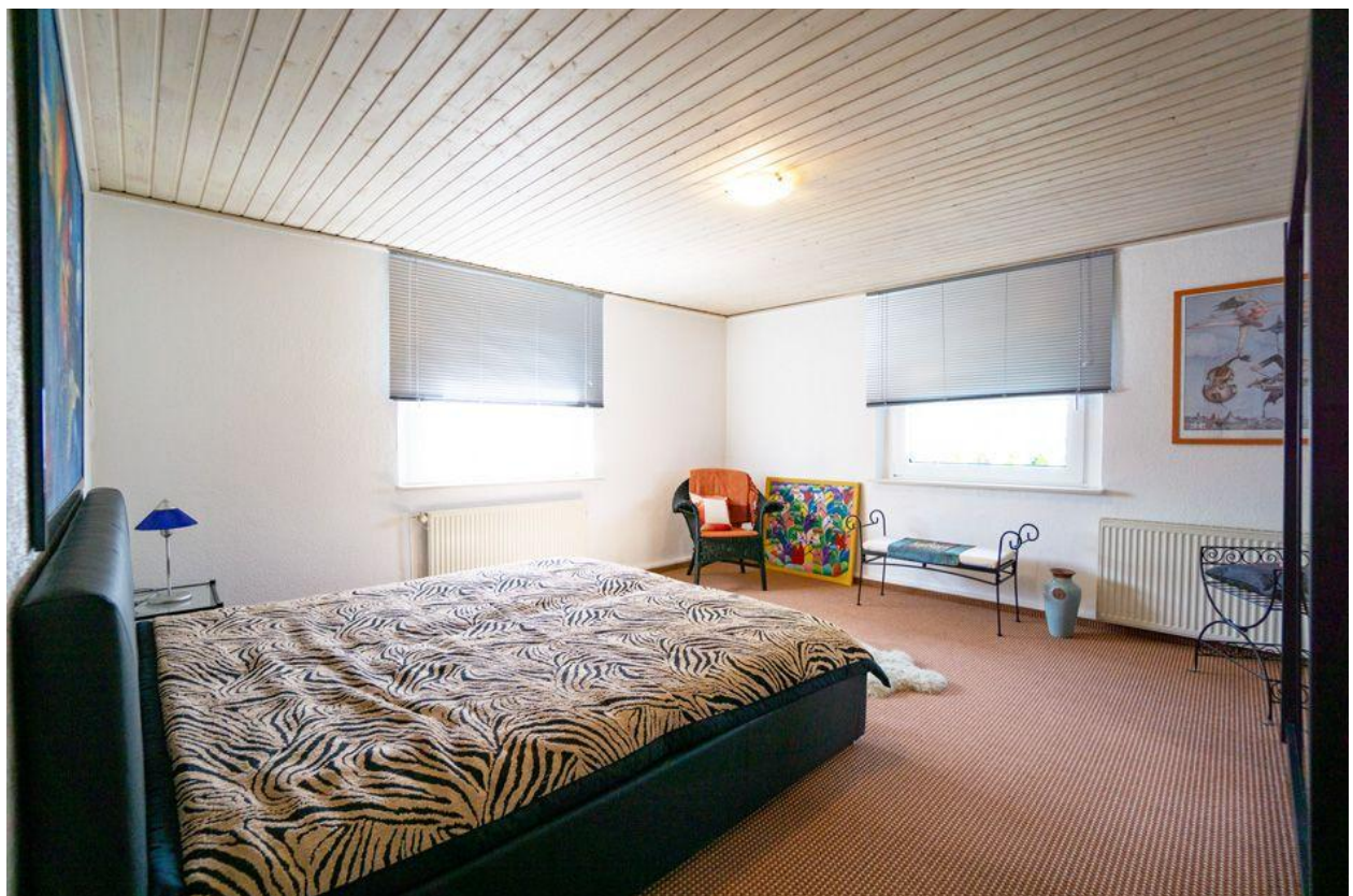
Schlafzimmer im OG