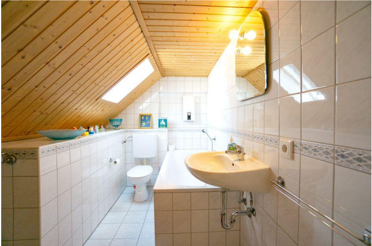
Bad im OG