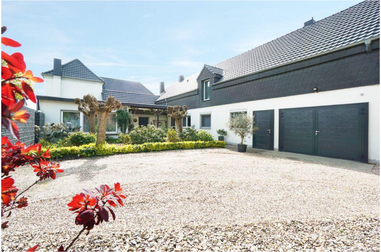
Kamp-Lintfort: Viel Platz