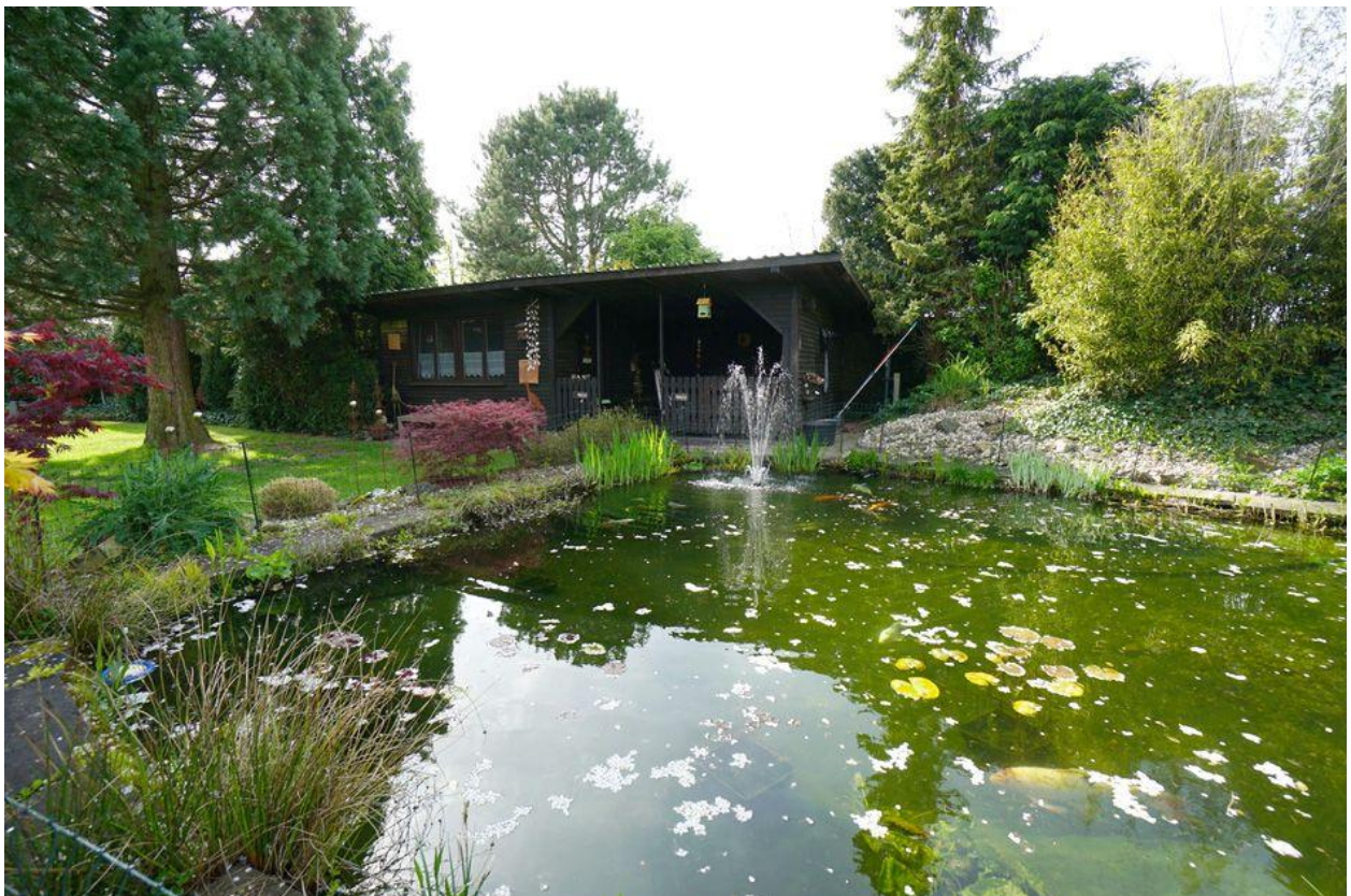
Teich mit Gartenhaus