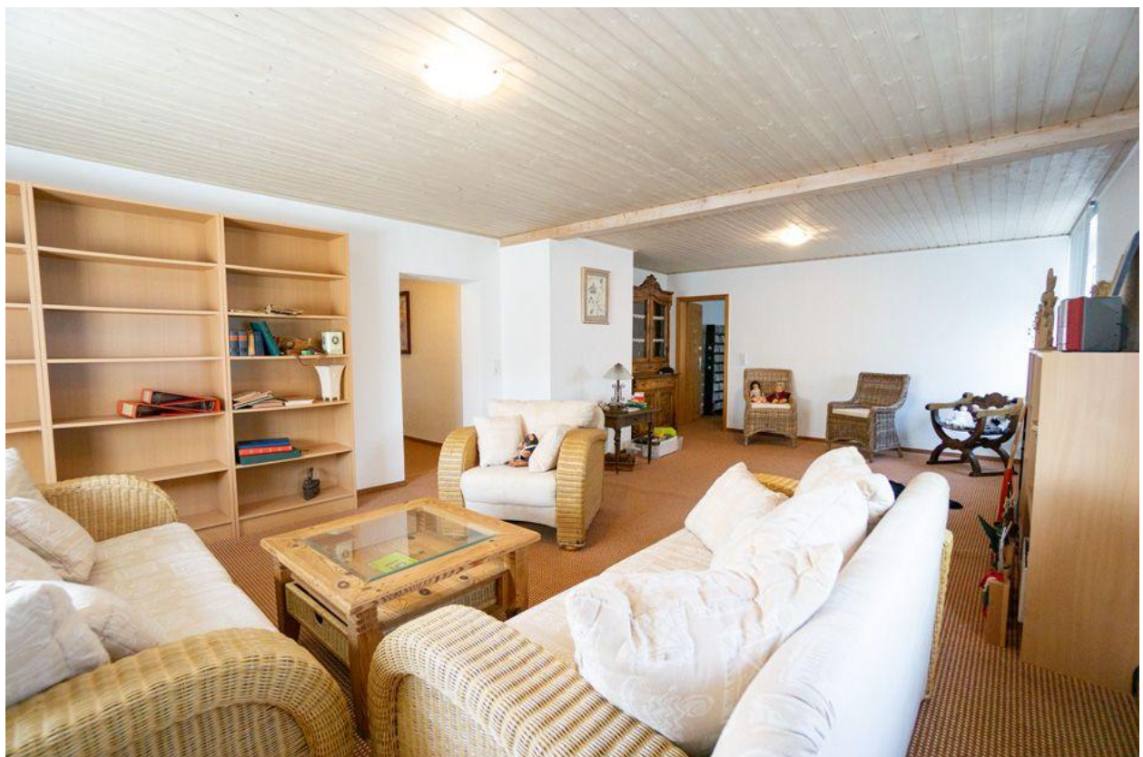
Wohnzimmer im OG