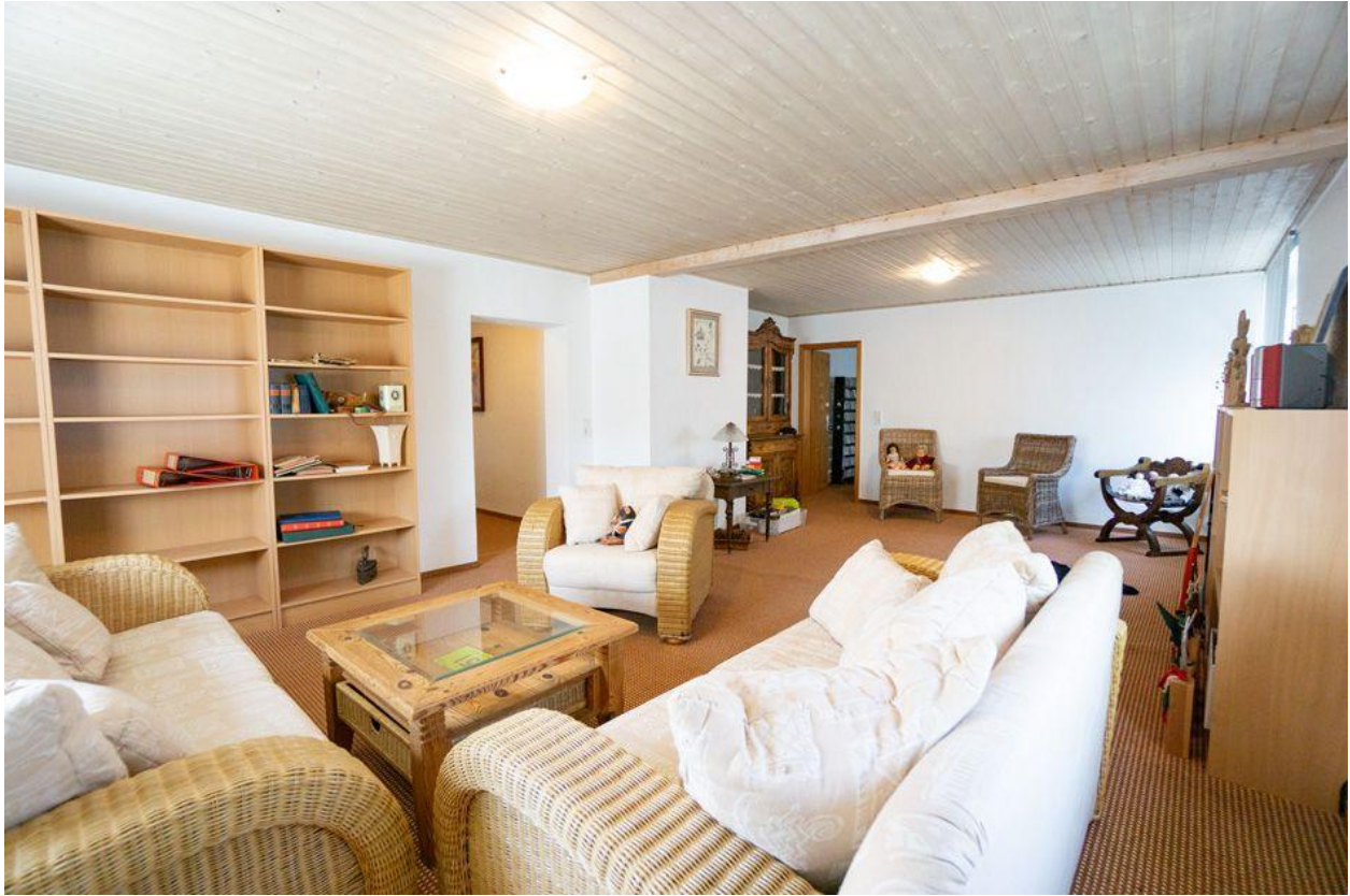
Wohnzimmer im OG