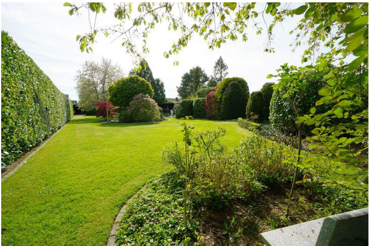
Kamp-Lintfort-Hoerstgen: Viel Platz