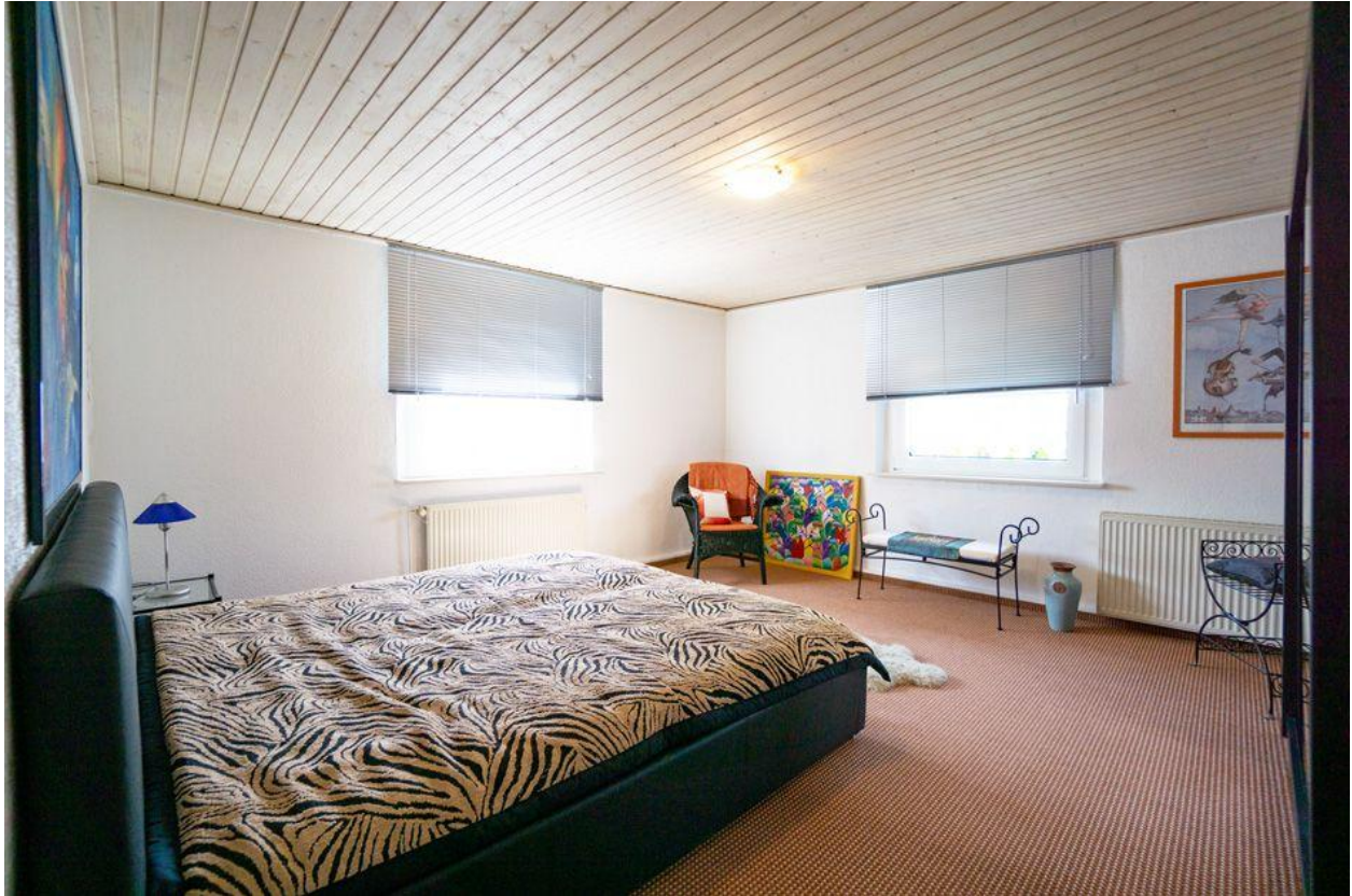
Schlafzimmer im OG