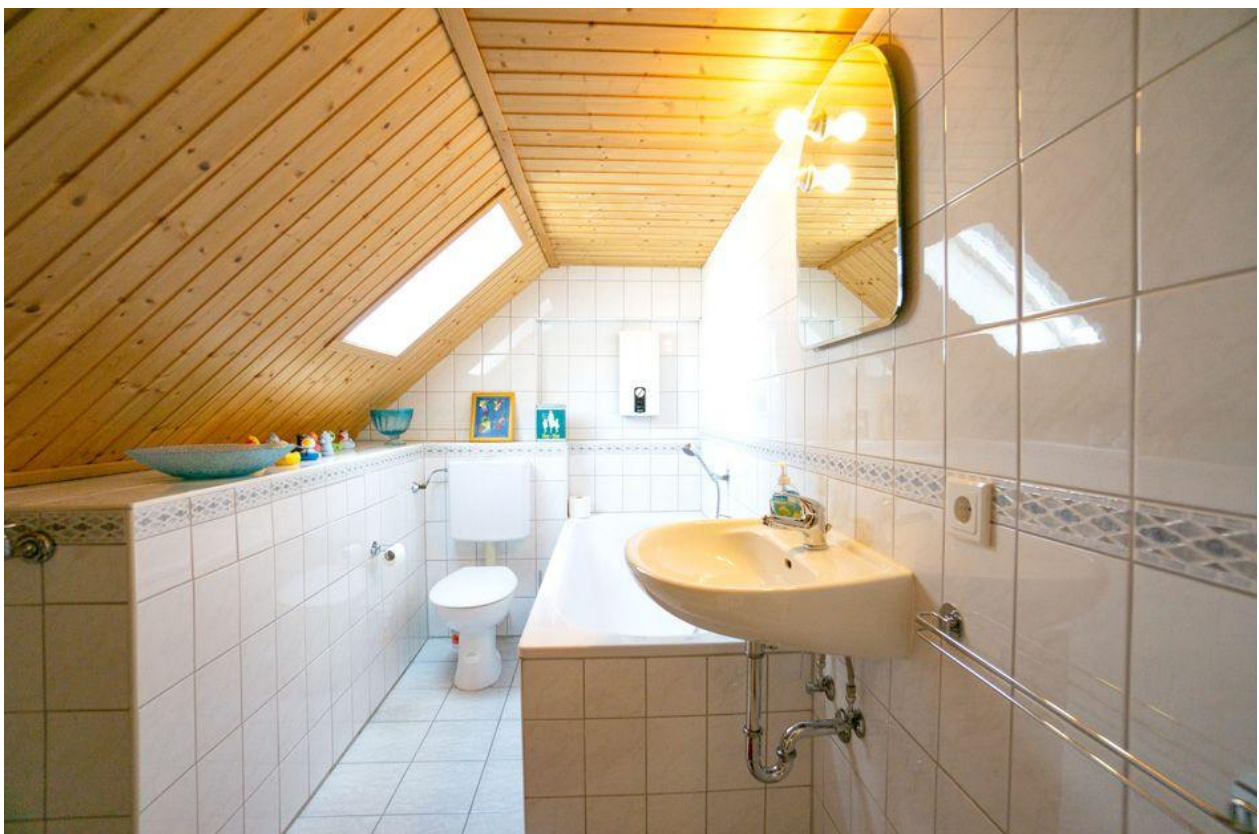
Bad im OG