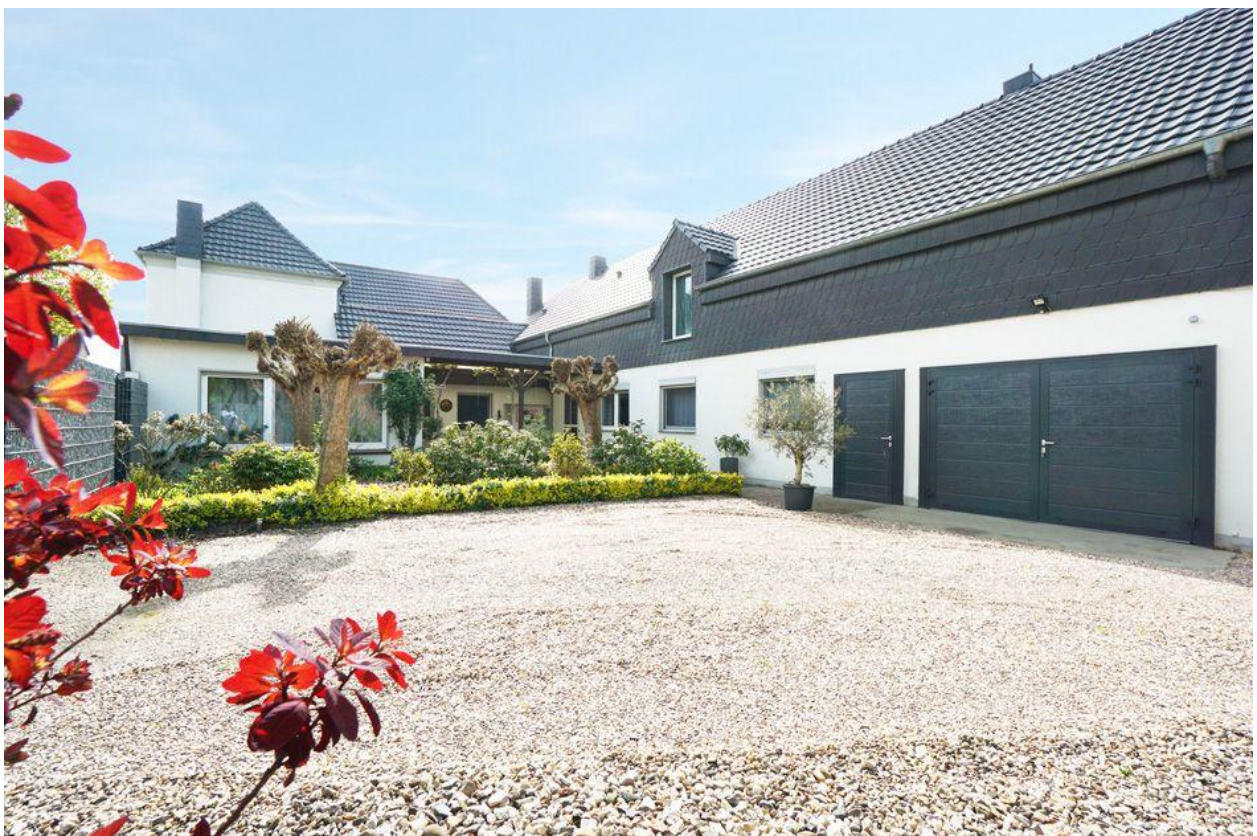
Kamp-Lintfort: Viel Platz