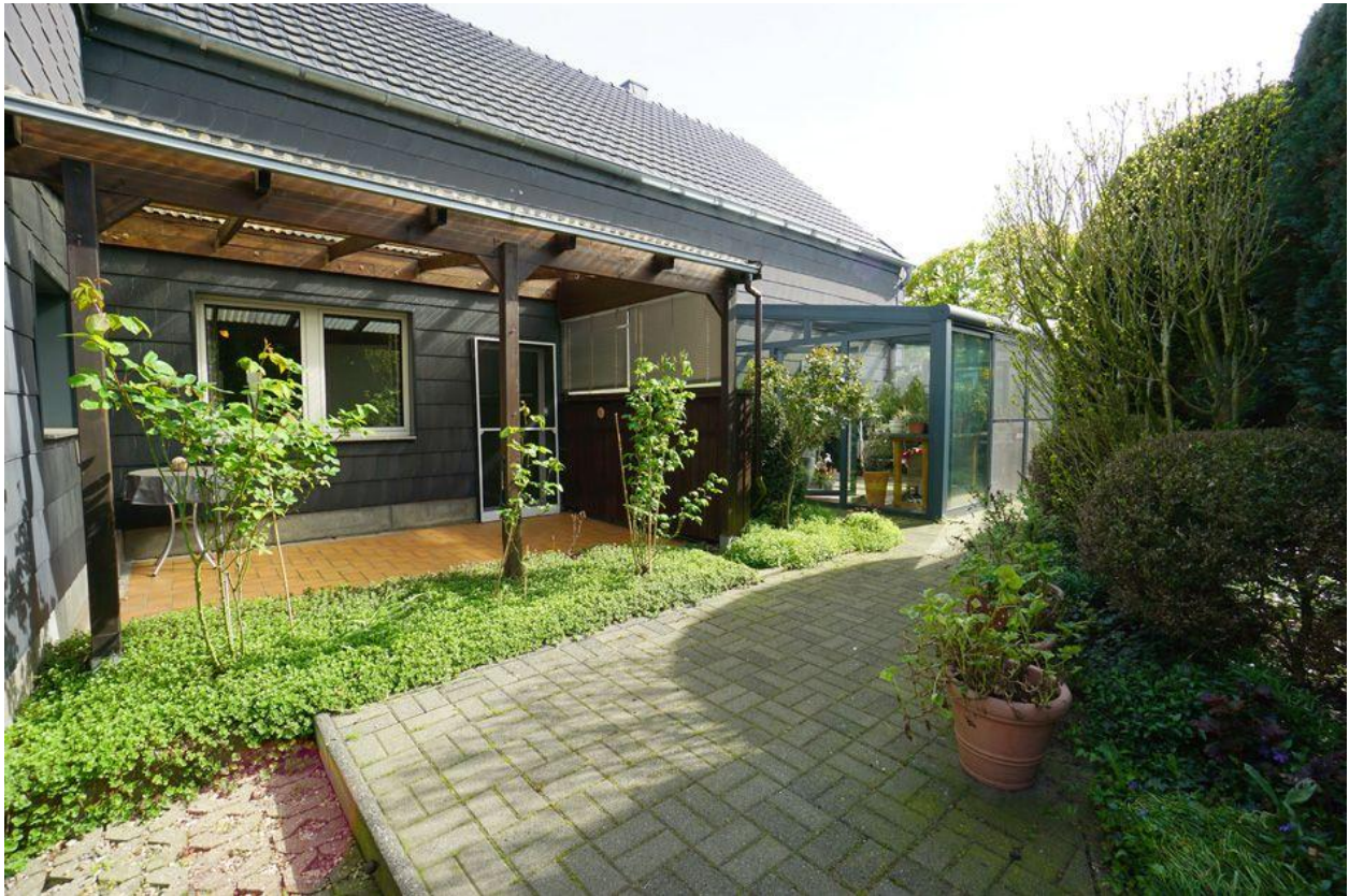
Kamp-Lintfort: Viel Platz