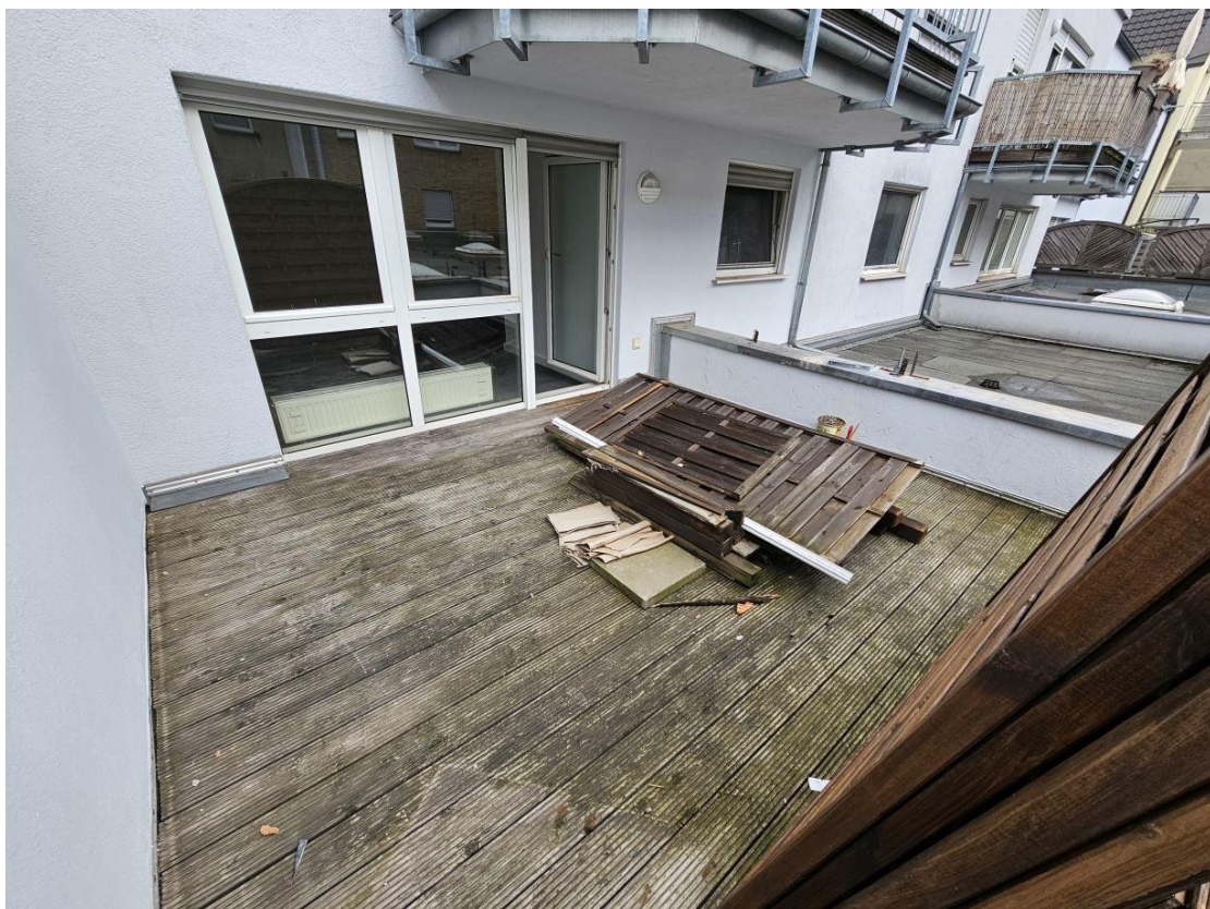
Dachterasse (wird neu gemacht)