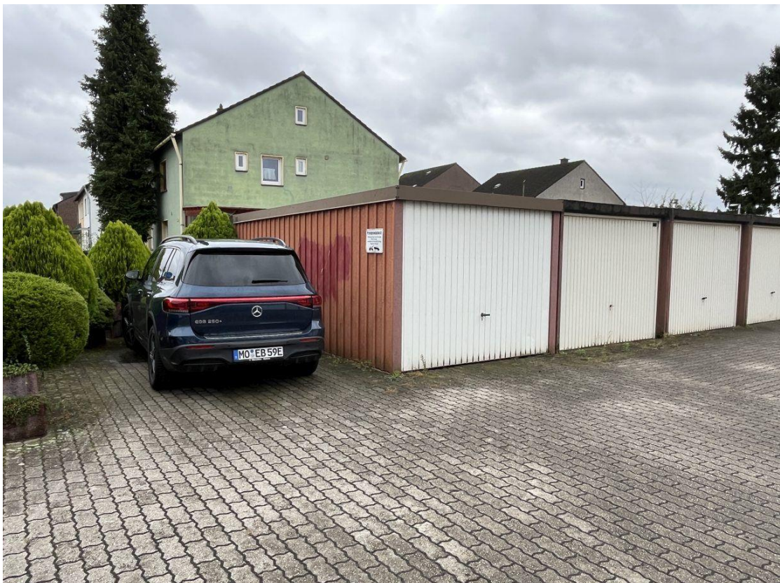
Garage und Stellplatz