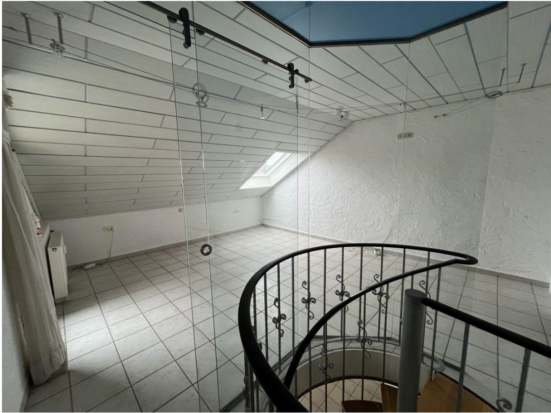
Wohn-/Schlafraum im DG