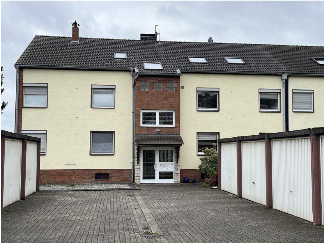
Maisonette-ETW in Moers-Repelen