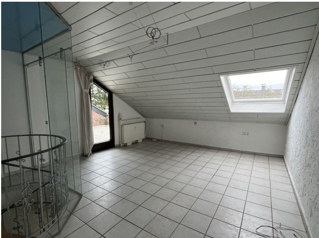
Wohn-/Schlafraum im DG