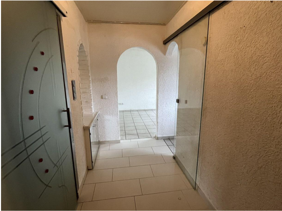
Eingang im 1. OG