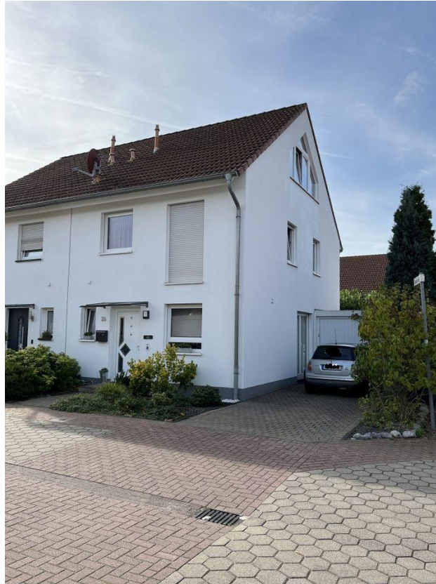
Moderne DHH in Moers-Asberg