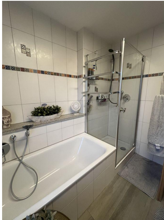
...Wanne und Dusche