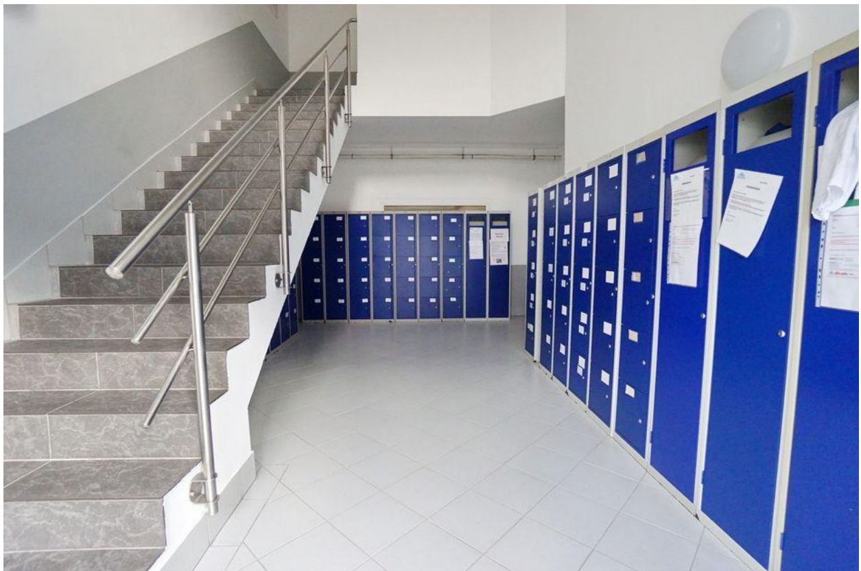
Zugang zu Sozialräumen