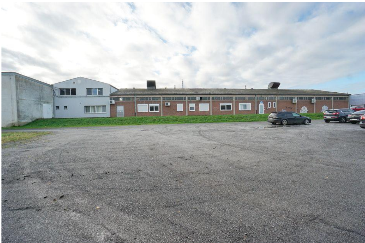
Seitenansicht und Freiflächen