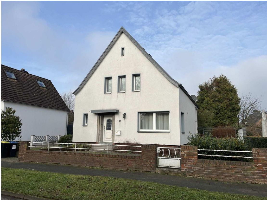
Einfamilienhaus in Moers-Utfort