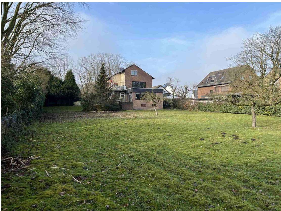
Blick zum Haus