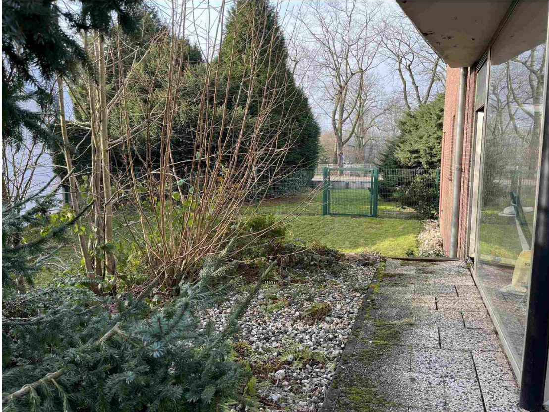
Grundstück links vom Haus