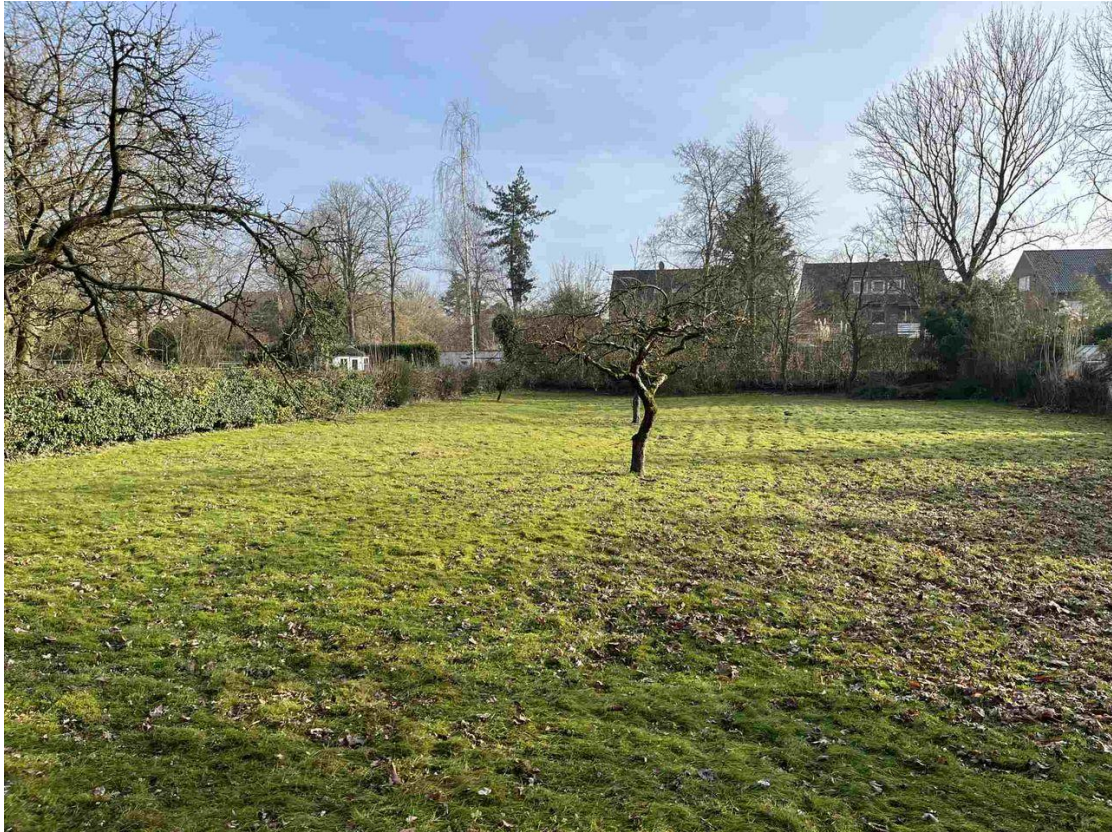
Blick auf das Grundstück