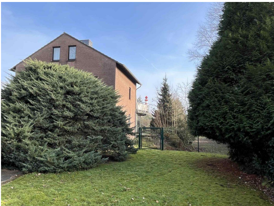
Grundstück rechts vom Haus