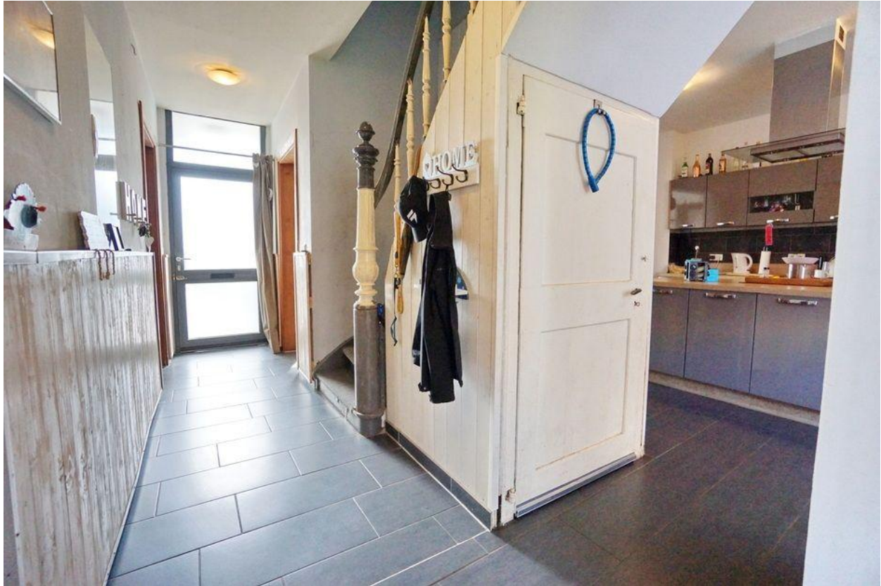
Flur im Erdgeschoss