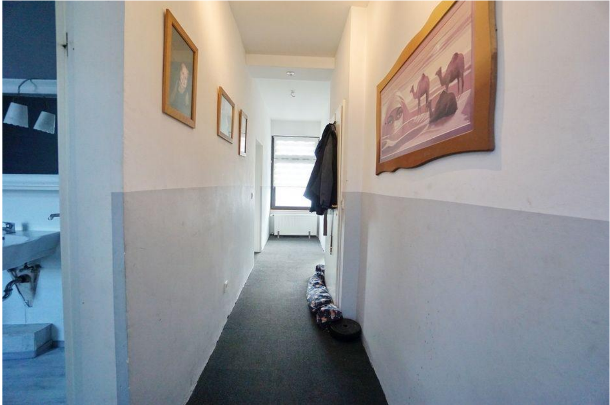
Flur im Dachgeschoss