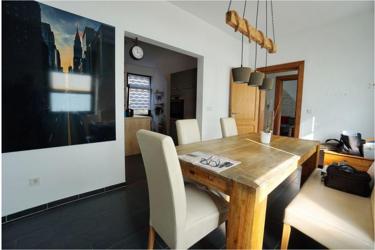
... mit Esszimmer