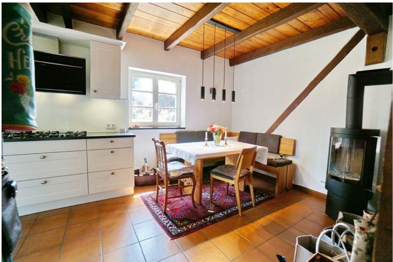
Küche mit Kaminofen