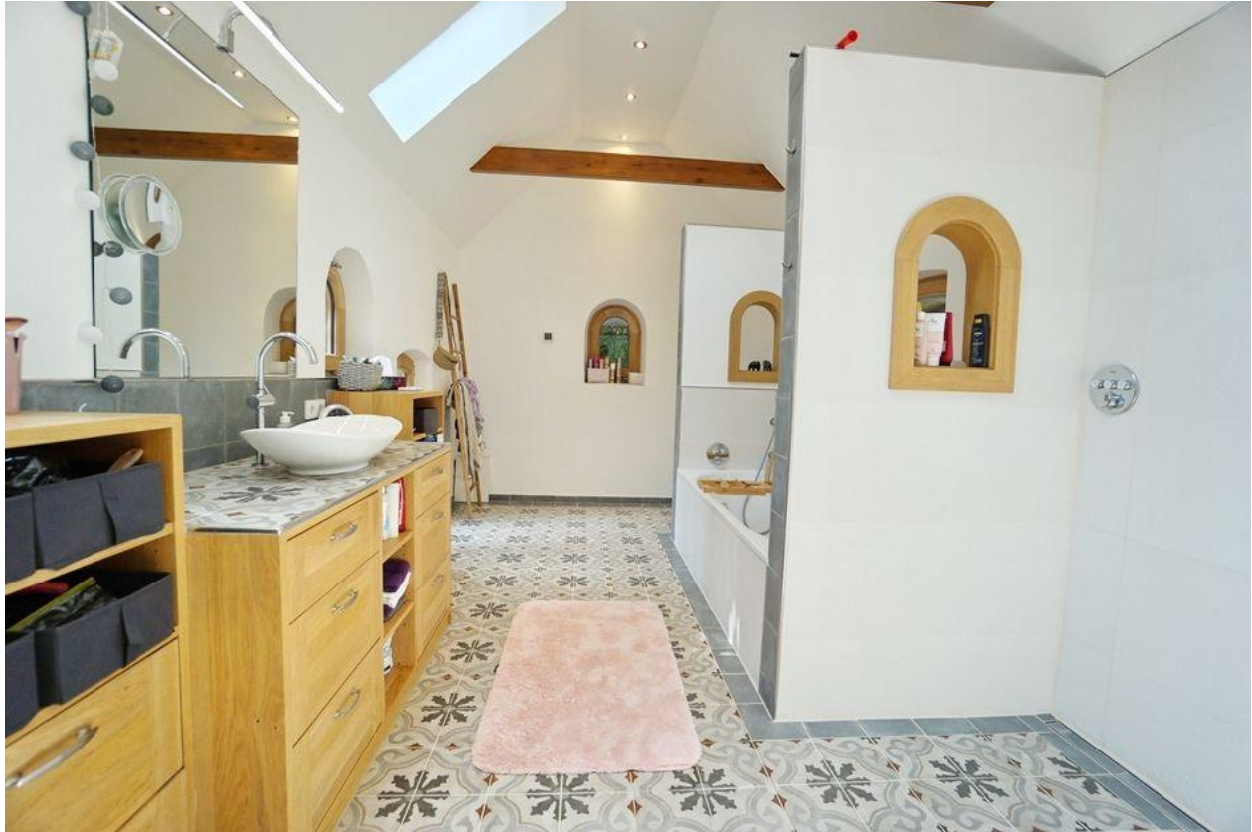
... mit Wanne und Dusche