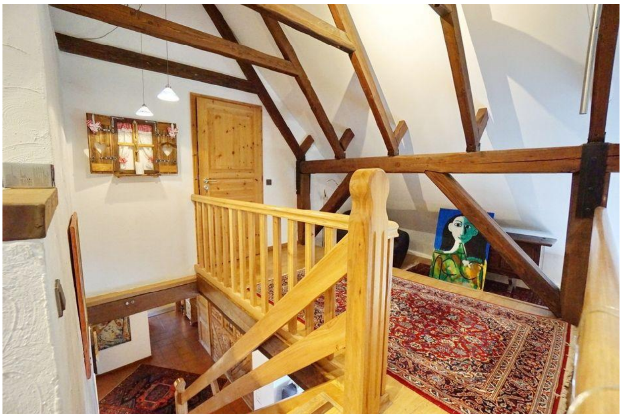
Zugang zum DG