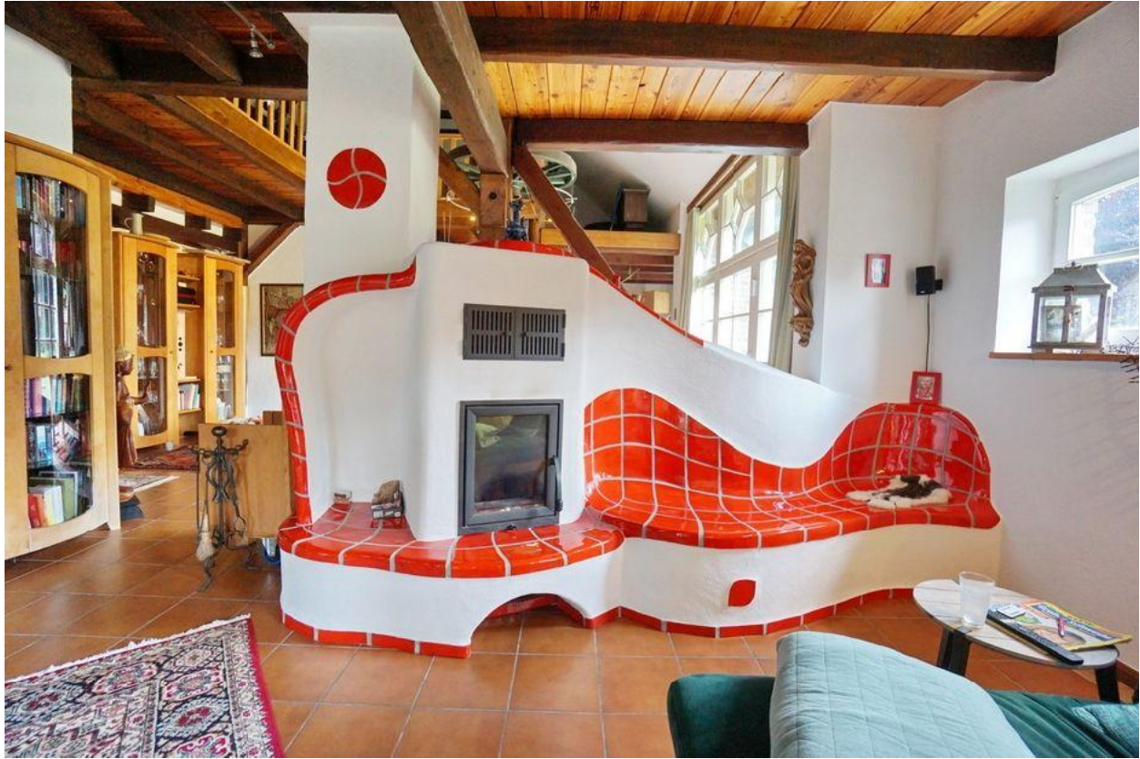
... nach Feng-Shui errichtet