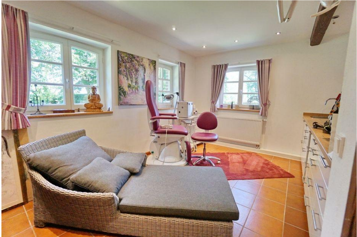
Arbeits- oder Gästezimmer