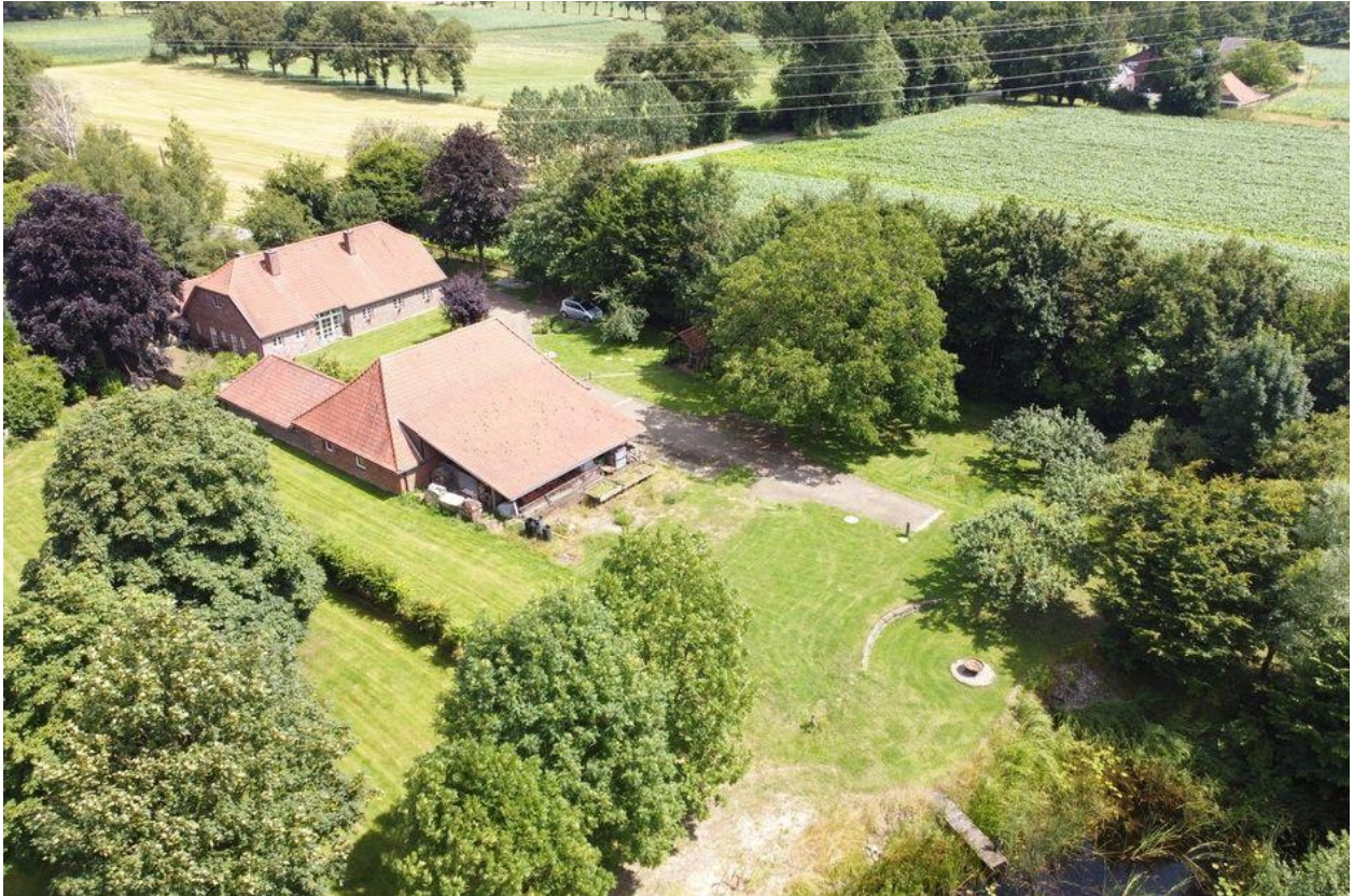
Sonsbeck: Historisches Bauernhaus