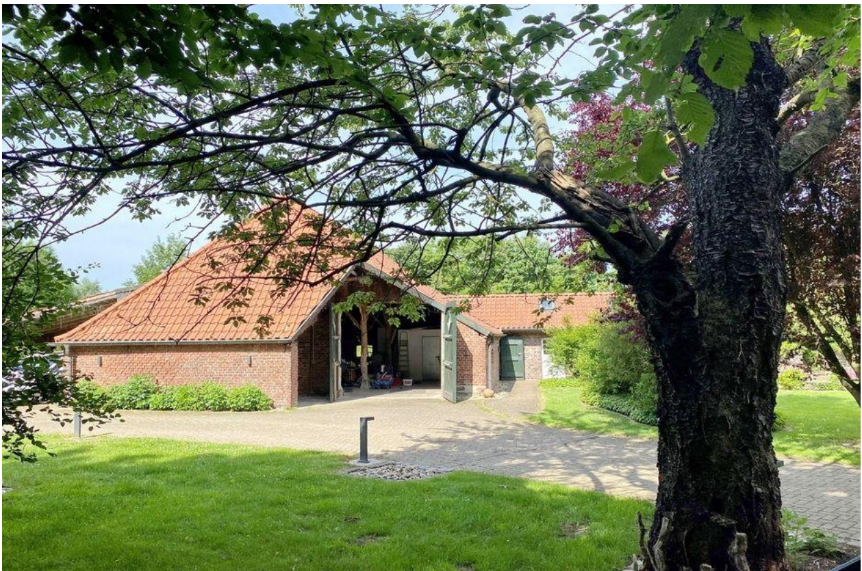
... mit Unterstand für PKWs