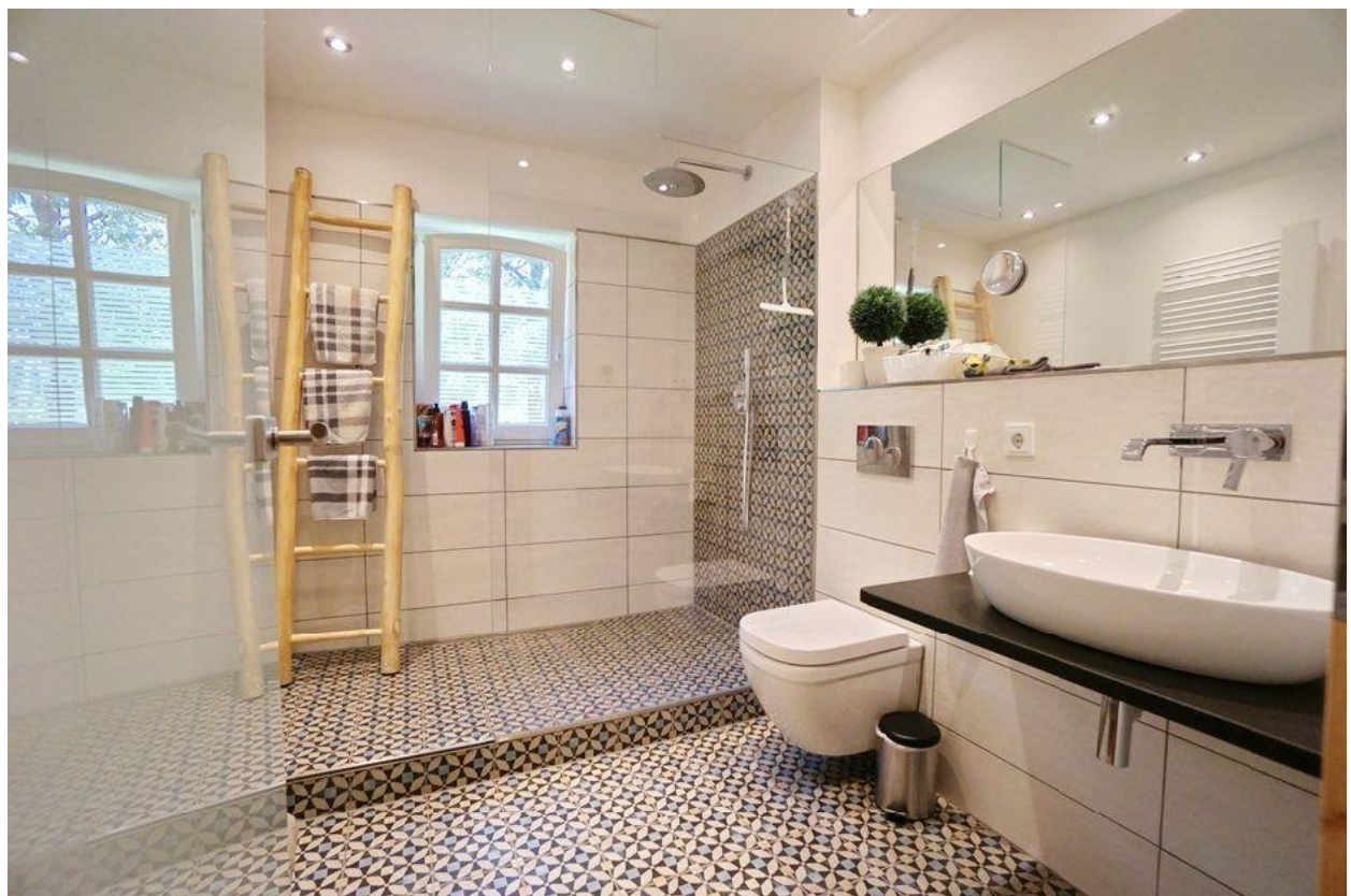
... und Zugang zum Bad