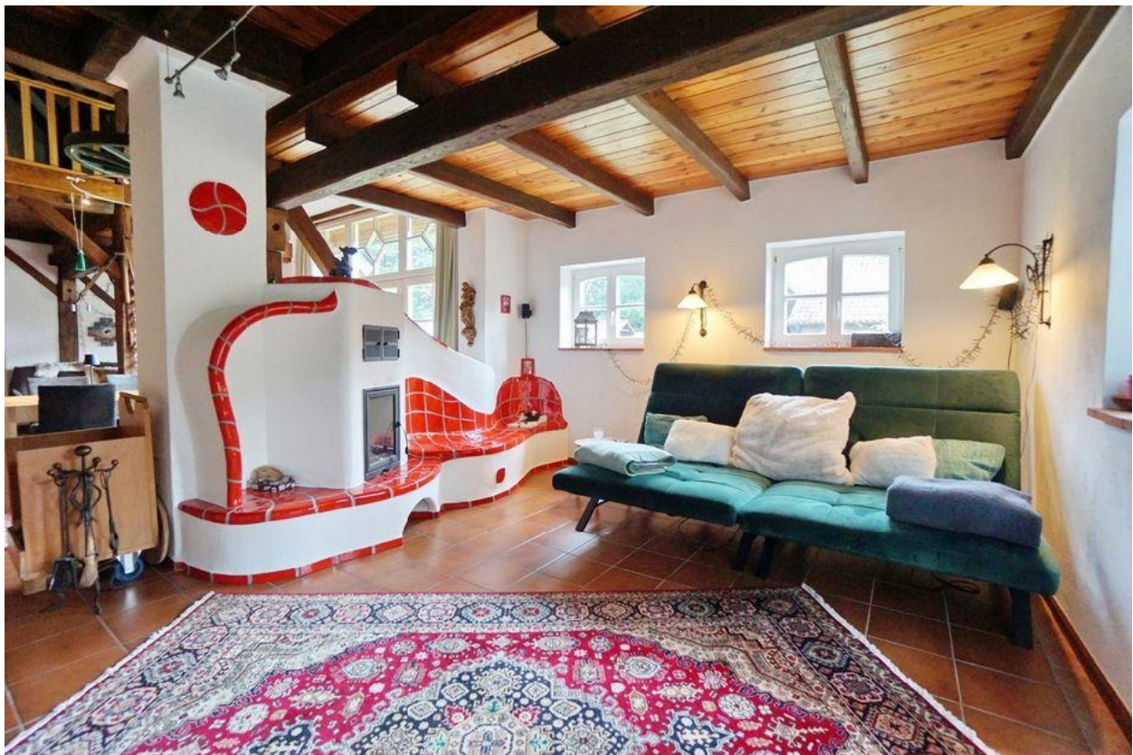
... mit Kaminofen