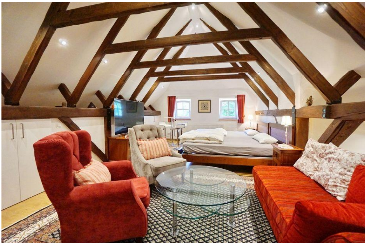
... und Wohnbereich