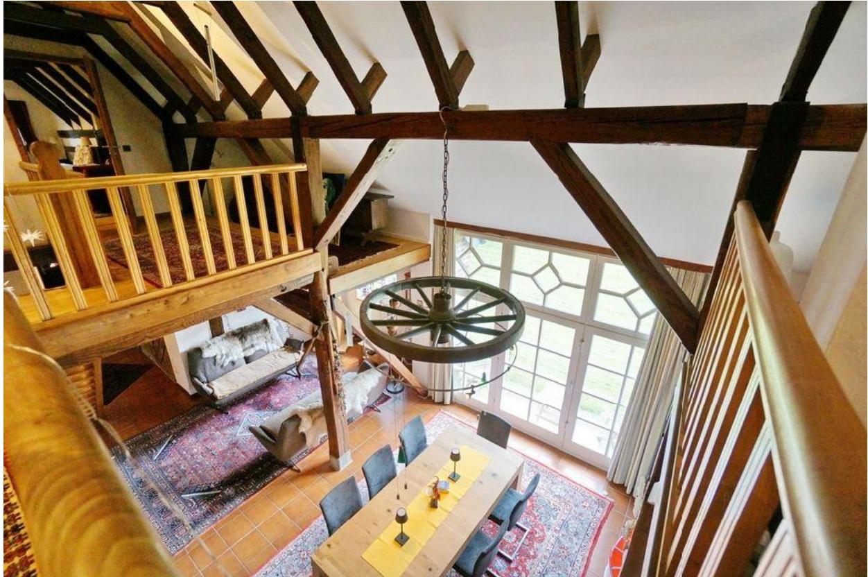
... mit Galerie