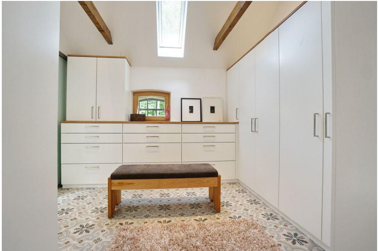
... mit Ankleidezimmer