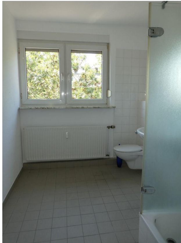
Duschbad mit Fenster