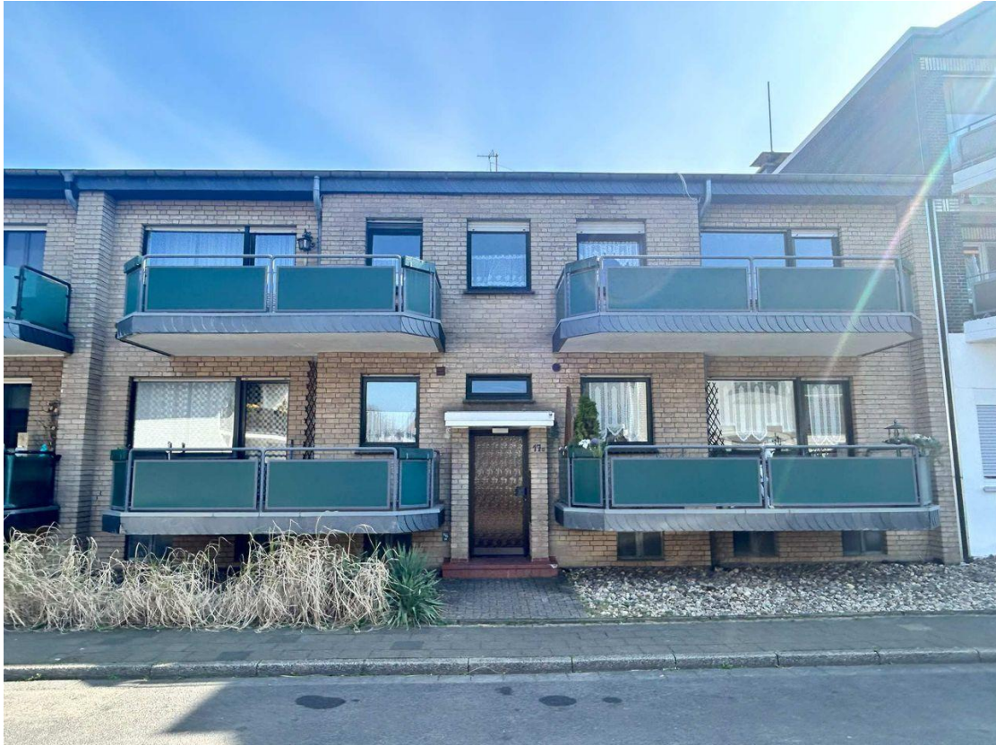
2-Zimmer-Souterrain-Wohnung in Neukirchen-Vluyn